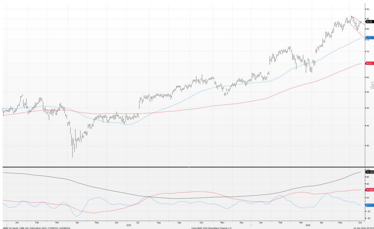
ABB mit 63- und 200-Tages-Durchschnitt (obere Hälfte der Grafik) und technischen Momentum-Indikatoren (untere Hälfte der Grafik).